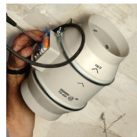
Przyłączenie przewodów zasilania