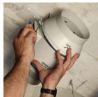
Instalacja głównego modułu wentylatora z puszką przyłączeniową zasilania