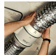
Montaż kanałów wentylacyjnych